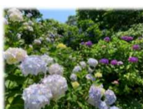
ふれあい広場北側斜面のアジサイ