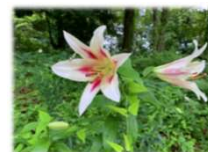
ユリ“オリエンタルハイブリッド”