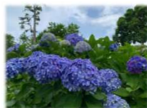
ふれあい広場北側斜面のアジサイ