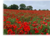
シャーレーポピー