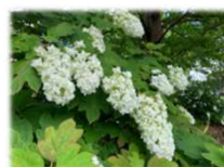
カシワバアジサイ

こもれびの里のハスが開花しました。また西立川口さざなみ広場には6月21日から鉢で展示を開始する予定です。