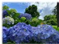
ふれあい広場北側斜面のアジサイ