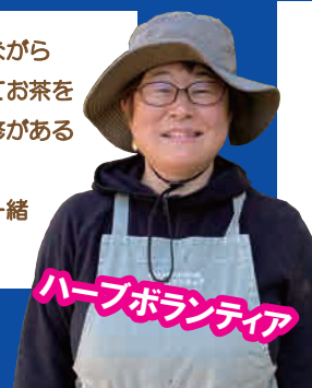
ハーブボランティア

花木園近くのハーブ園でよい香りに包まれながら作業をしています。収穫したハーブを使ってお茶を淹れたり、染色や蒸留、クラフトなどの研修があるのも嬉しいところです。お気に入りハーブをみつけ、楽しみながら一緒に愛でていきましょう。