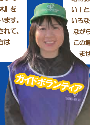
ガイドボランティア

昭和記念公園の多くの花に魅せられ、もっと深く知りたい！とガイドボランティアに飛び込みました。今はいろいろな先輩方と共に、来園者の方と季節の風景を楽しみながらの活動に充実感を感じています。世代の枠を超え、この場所を愛する仲間と一緒に、公園の魅力を伝えてみませんか？ご参加をお待ちしています。