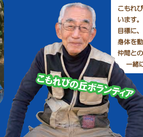
こもれびの丘ボランティア

こもれびの丘ボランティア活動を設立当初から行っています。自然豊かで野草も咲く『武蔵野の雑木林』を目標に、仲間と知恵を出し合って作業に励んでいます。身体を動かすことで健康に良く、四季を感じ癒されて、仲間との交流がとても楽しいです。興味のある方は一緒にボランティア活動をしませんか？