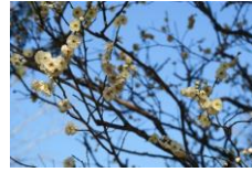
麝香梅(じゃこうばい)