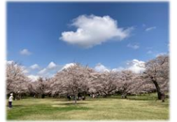
染井吉野 (ソメイヨシノ)

ソメイヨシノは桜の園で見頃、旧桜の園で見頃終盤を迎えています。どちらも今週末頃まで見頃の予想ですが、旧桜の園は少し早く散り始めています。