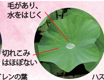
切れこみはほぼない