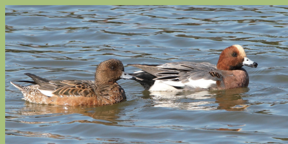
ヒドリガモ (左はメス、右はオス)