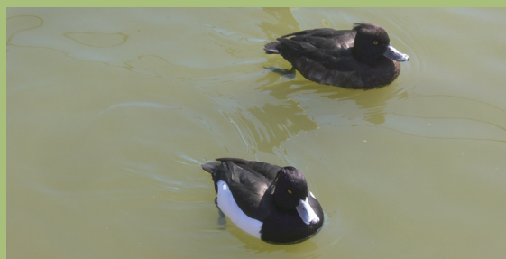
キンクロハジロ (手前はオス、後ろはメス)