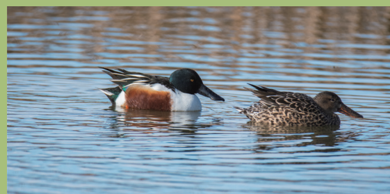
ハシビロガモ (左はオス、右はメス)