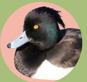
冬しかみられないキンクロハジロ