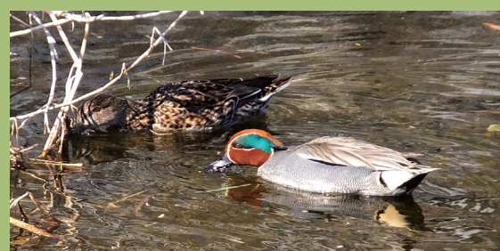
コガモ (左はメス、右はオス)