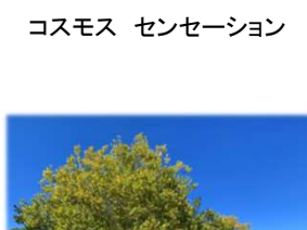
コスモス センセーション