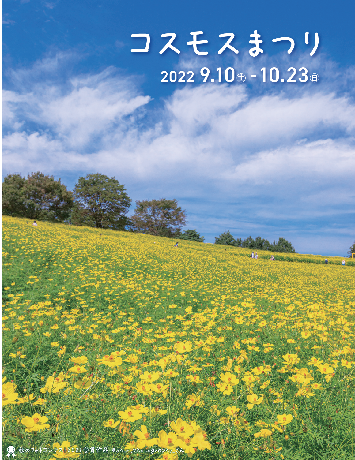
秋のフォトコンテスト2021受賞作品