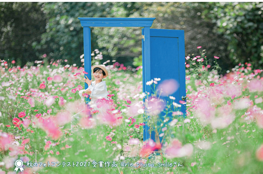
秋のフォトコンテスト2021受賞作品