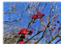
ウメ 大盃（おおさかずき）

こもれびの池：八重寒梅（やえかんばい）、八重寒紅（やえかんこう）、寒衣（かんころも） 冬至（とうじ）、鹿兒島紅（かごしまこう）、錦光（きんこう）、麝香梅（じゃこうばい） 八重冬至（やえとうじ）、八重野梅（やえやばい）、月影（つきかげ） 紅冬至（べにとうじ）、黒雲（くろくも）、佐橋紅（さばしこう）