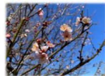
ウメ 紅冬至（べにとうじ）