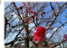
ウメ 寒衣(かんころも)