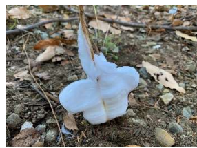
シモバシラ ※寒い朝に、一定の条件を満たすと見れます。