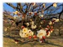
ウメ 八重野梅(やえやばい)