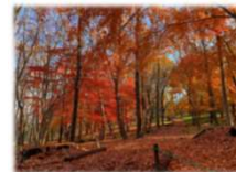
こもれびの丘北斜面のカエデ類