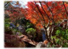
北の大滝のカエデ類