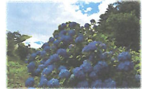
ふれあい広場北側のアジサイ