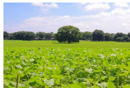
成長中のハイブリッドサンフラワー (例年は公園北側の花畑で展開)